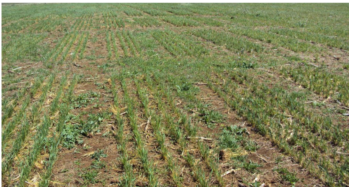
Antes e depois da ação de integrantes do MST no campo experimental de trigo conduzido na Fepagro, em Vacaria, safra 2011/2011.